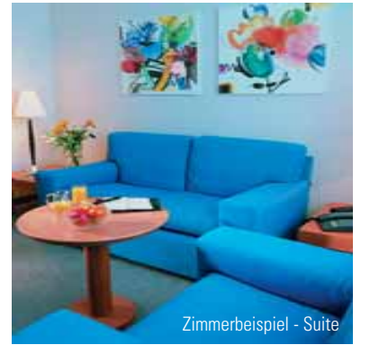
Zimmerbeispiel - Suite