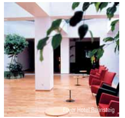
Foyer Hotel Rennsteig