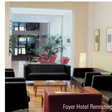
Foyer Hotel Rennsteig